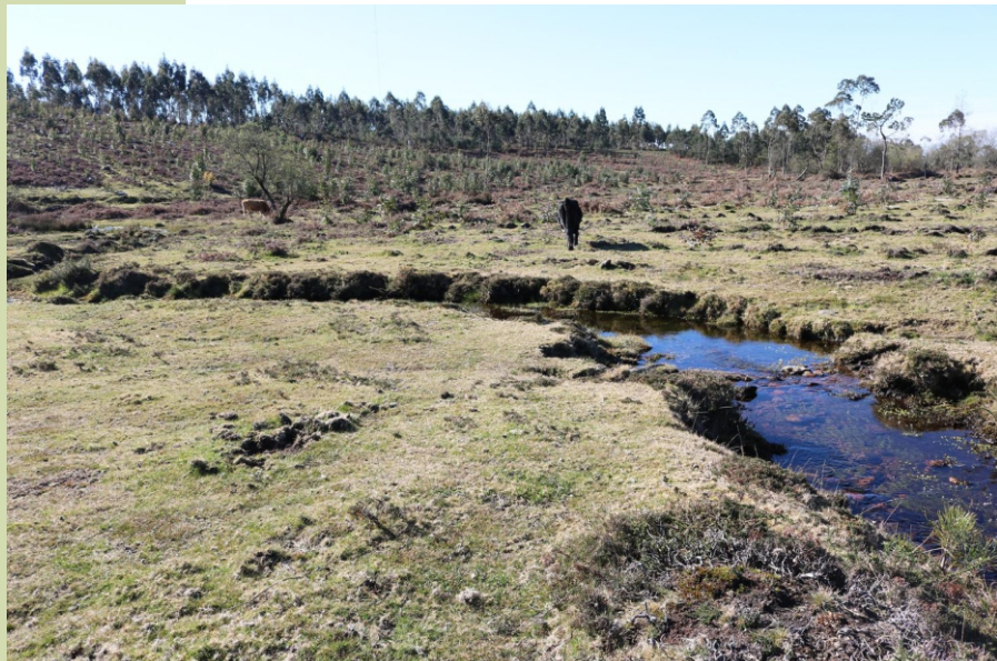
Río Rons curto percorrido pero varias zonas de interese: as brañas do seu nacemento, o encoro de Pontillón de Castro e as xunqueiras de Alba, espazo natural de interese local de Pontevedra.

O encoro non é importante polo seu tamaño pero si pola súa utilidade: foi construído a mediados do século XX como unha das fontes de abasto de auga para a cidade de Pontevedra e desde comezos do século XXI tamén está acondicionado como espazo para o desenvolvemento de probas deportivas. Ten un camiño que o rodea, de case 3,5 km, e unha área de lecer con miradoiro na súa contorna o que o converte nun lugar moi axeitado para unha visita ou un paseo. E o Acibal destaca polas panorámicas de 360º que se abranguen desde el: polo oeste a costa, as illas Cies, as rías de Pontevedra e da Arousa, e as serras que as limitan; e o interior cos montes Xiabre, Xesteiras e os montes dos Cregos, ao norte, ao leste até os cumes da Dorsal Galega, ao sur os montes da Castrelada, A Fracha, a serra do Galleiro... e no seu pé as brañas das fontes do río Rons e o curro de Amil.