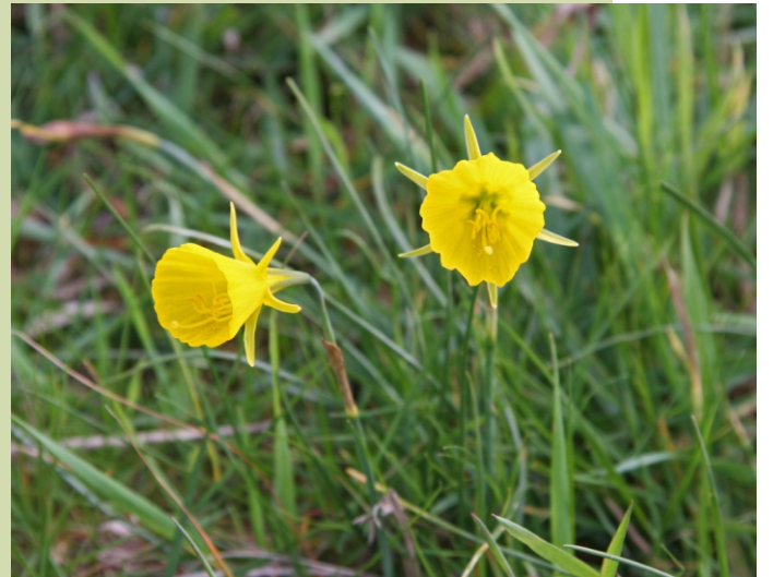
Plantas típicas das brañas e flores de Narcissus bulbocodium