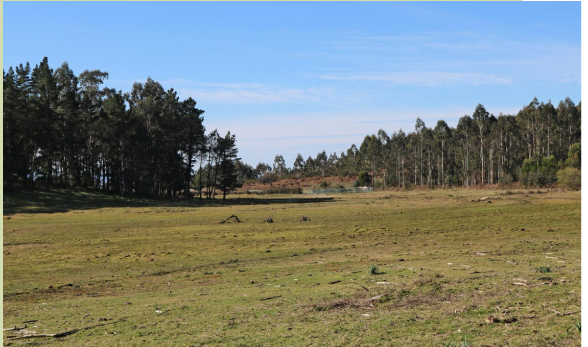
Brañas e curro