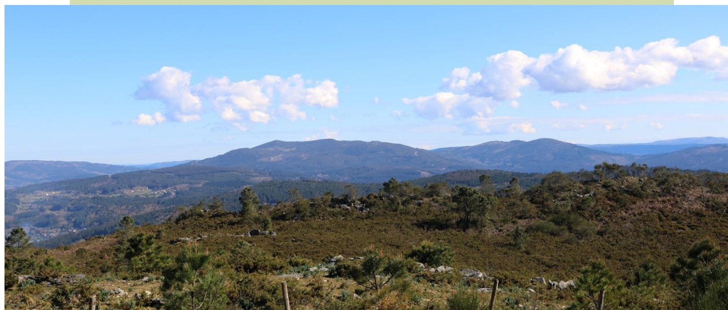
Vista desde o cume do Acibal cara ao leste