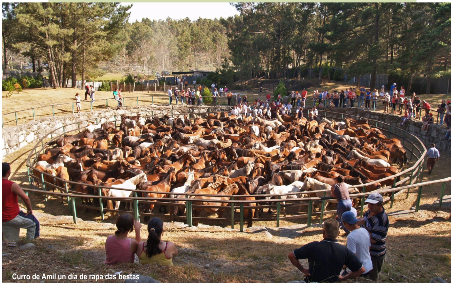
Curro de Amil un día de rapa das bestas

O curro de Amil celébrase no lugar do Pasteiro, na parroquia de Amil (Moraña). Os cabalos que viven todo o ano libres báixanse do monte para ser separados, marcados, e rapados.