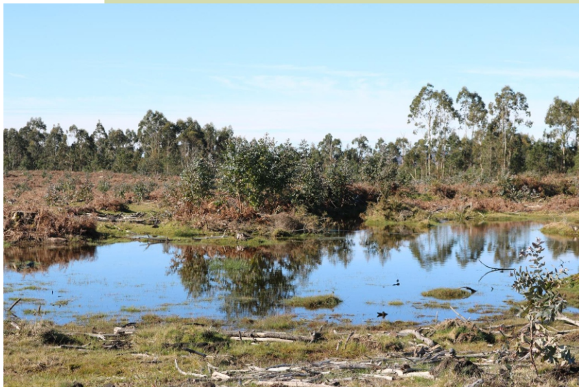
Unha boa parte da área das brañas está ocupada por plantacións de eucaliptos. As brañas son zonas húmidas onde se acumula a auga que serve de reserva e nacemento de ríos