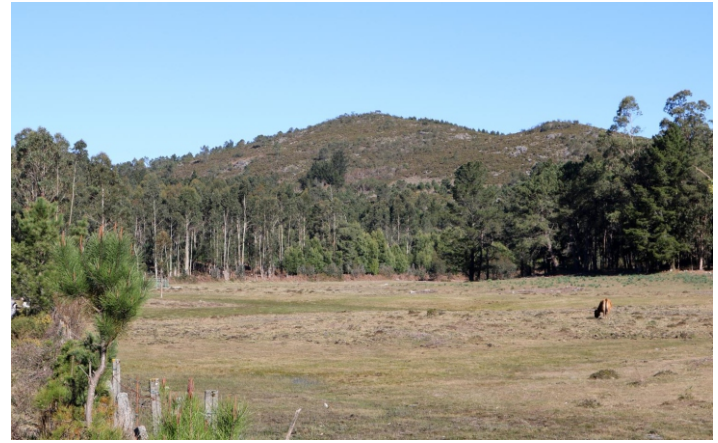
Cume do Acibal desde as brañas