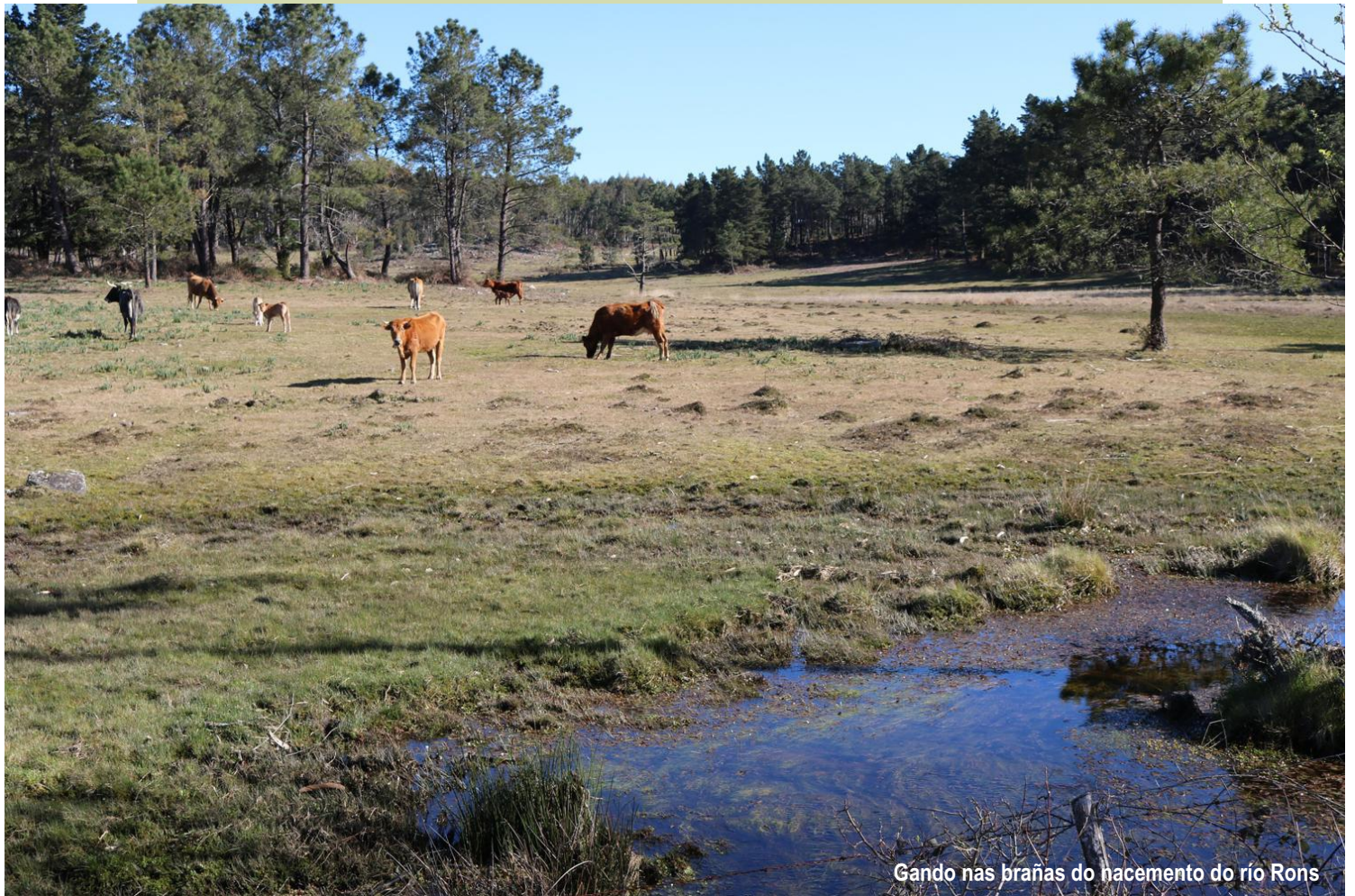
Gando nas brañas do nacemento do río Rons