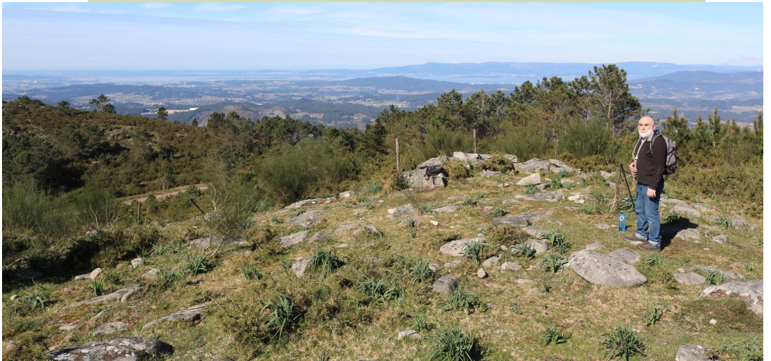
Vista desde o cume do Acibal cara á ría da Arousa