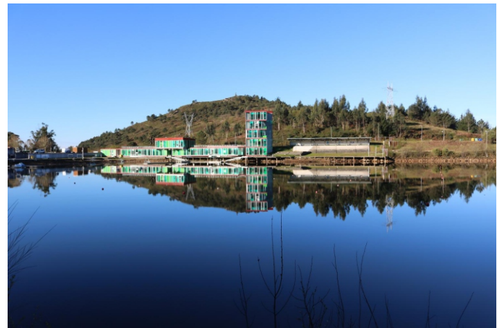
Encoro de Pontillón de Castro

Unha camiñada con dous puntos de interese: o encoro e o cume, que tamén poden ser dúas visitas puntuais porque o espazo entre un e o outro discorre por pistas forestais, entre eucaliptos, nas que non hai nada de interese, a non ser algunha pereira brava, que resiste, e algúns carballos novos, que conseguen saír adiante apurando as escasas opcións que se lle presentan de aproveitar a luz e o terreo nas beiras dun espazo inzado de competidores que os abafan, e algunhas plantas menores que, na primavera, amosan as súas flores.