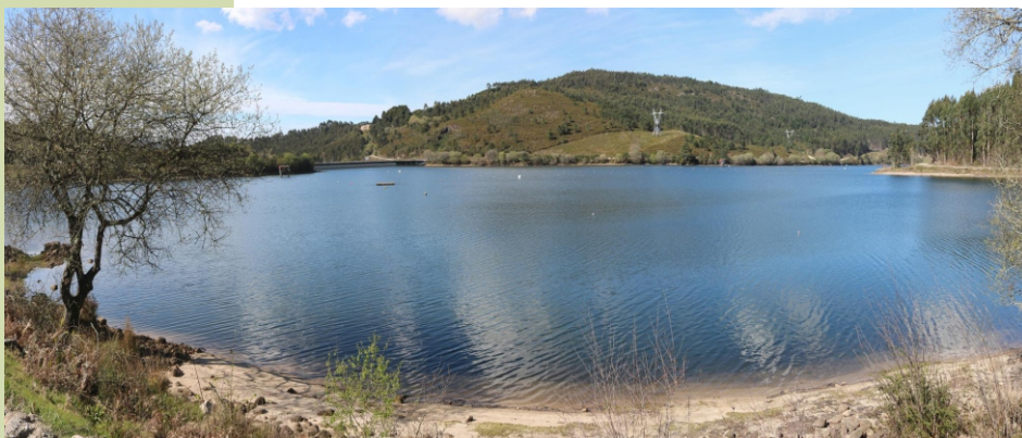
Panorámica do encoro de Pontillón de Castro

Indo á dereita pola estrada chegamos ao peche do pasteiro das brañas do nacemento do río Rons , onde se atopa o curro. De alí mesmo sae unha pista que o rodea e, á esquerda, un camiño descoidado entre piñeiros que leva ao arranque da subida ao cume do Acibal , pero é máis doado seguir a pista ata chegar a un atallo ou, un pouco adiante, ao arranque dunha pista á esquerda que nos leva ata o alto onde temos, á dereita, unha costa recta e de forte pendente, o derradeiro obstáculo para chegar ao cume. A volta podemos facela polo camiño da ida, ou baixar pola outra pendente ata unha pista que nos leva de volta ao pé do peche do pasteiro. Seguímolo, indo cara á esquerda, ata a estrada e alí imos á dereita para chegar ao acceso ao curro (podemos achegarnos a coñecelo). Volvemos logo á estrada para completar a volta ao peche e comezamos o camiño de volta polo mesmo que a ida -estrada, arranque da pista..., pero na volta de desviarnos cara o alto da Lumieira seguimos pola pista principal e, sen deixala, volvemos á pista pola que subimos case ao pé do encoro. Podemos rematar dándolle a