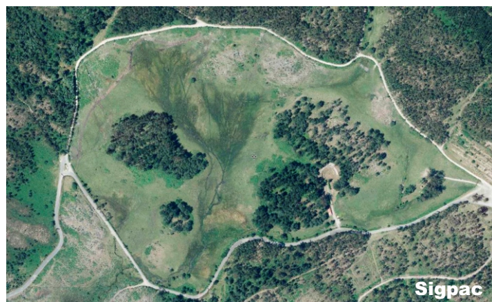
Brañas do nacemento do río Rons