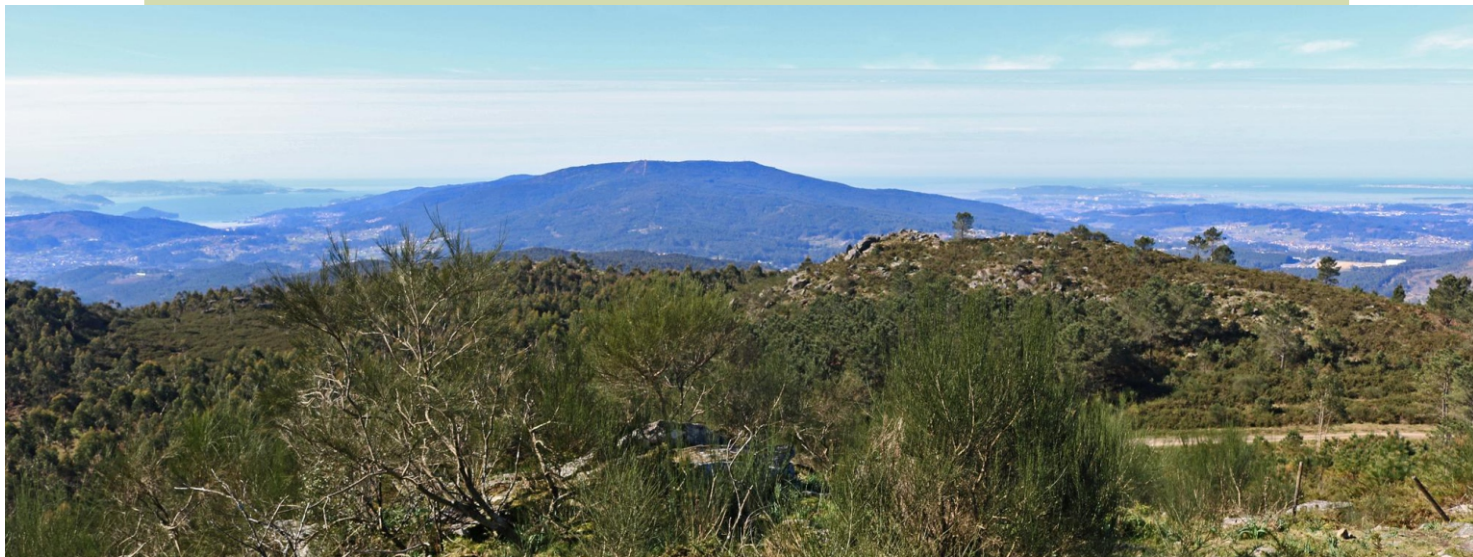
Vista desde o cume do Acibal: a ría de Pontevedra, o Castrove e a ría de Arousa