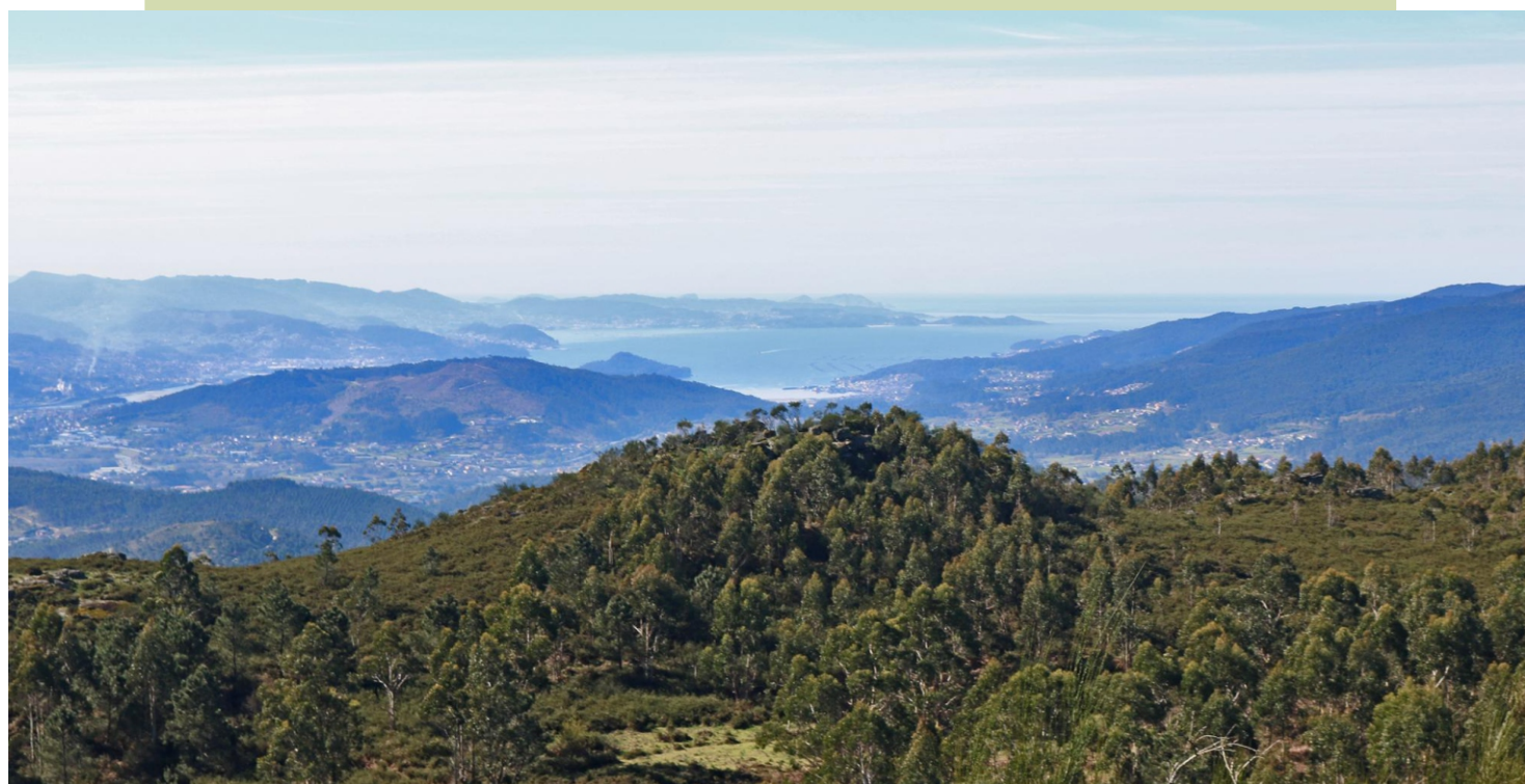
Vista desde o cume do Acibal cara á ría de Pontevedra