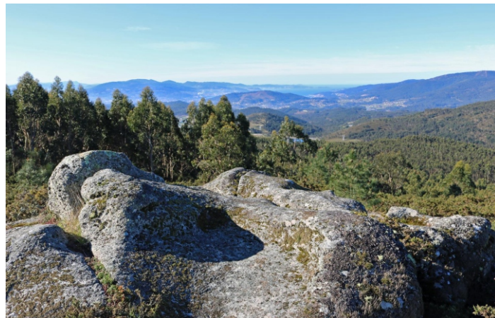
Alto da Lumieira