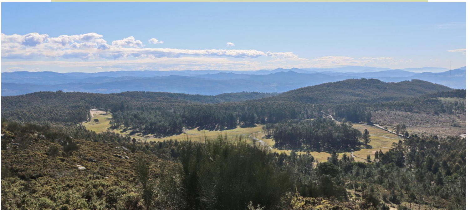
Vista desde o cume do Acibal cara ao norte, coas brañas do río Rons